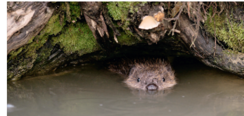
Wo geht die Reise wohl hin?

NEWSLETTER DER 10-JAHRES-AKTION VON PRO NATURA BASELLAND